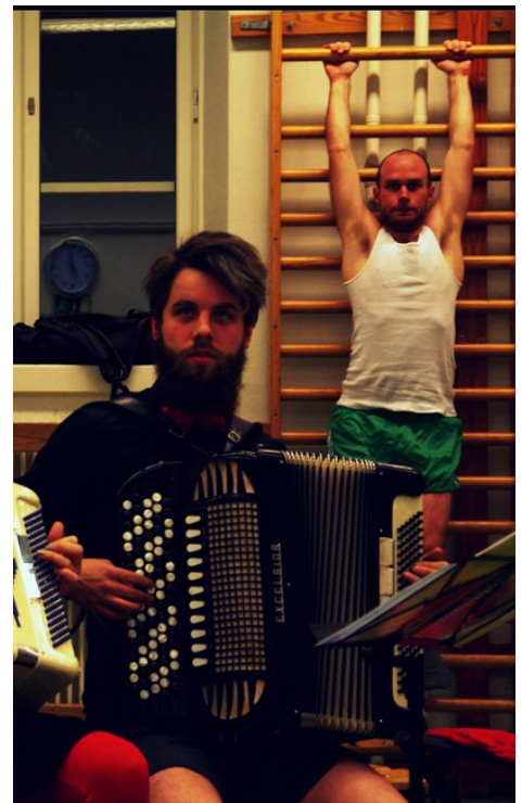
Jerk och Falcken samspelar på premiären av de nu så berömda "Dragspelsgympan"

Bra jobbat av managern på den tiden! Nu har jag hört att CDG inte får så mycket gig? Får vi höra några ljuva toner på söndag, om inte - när